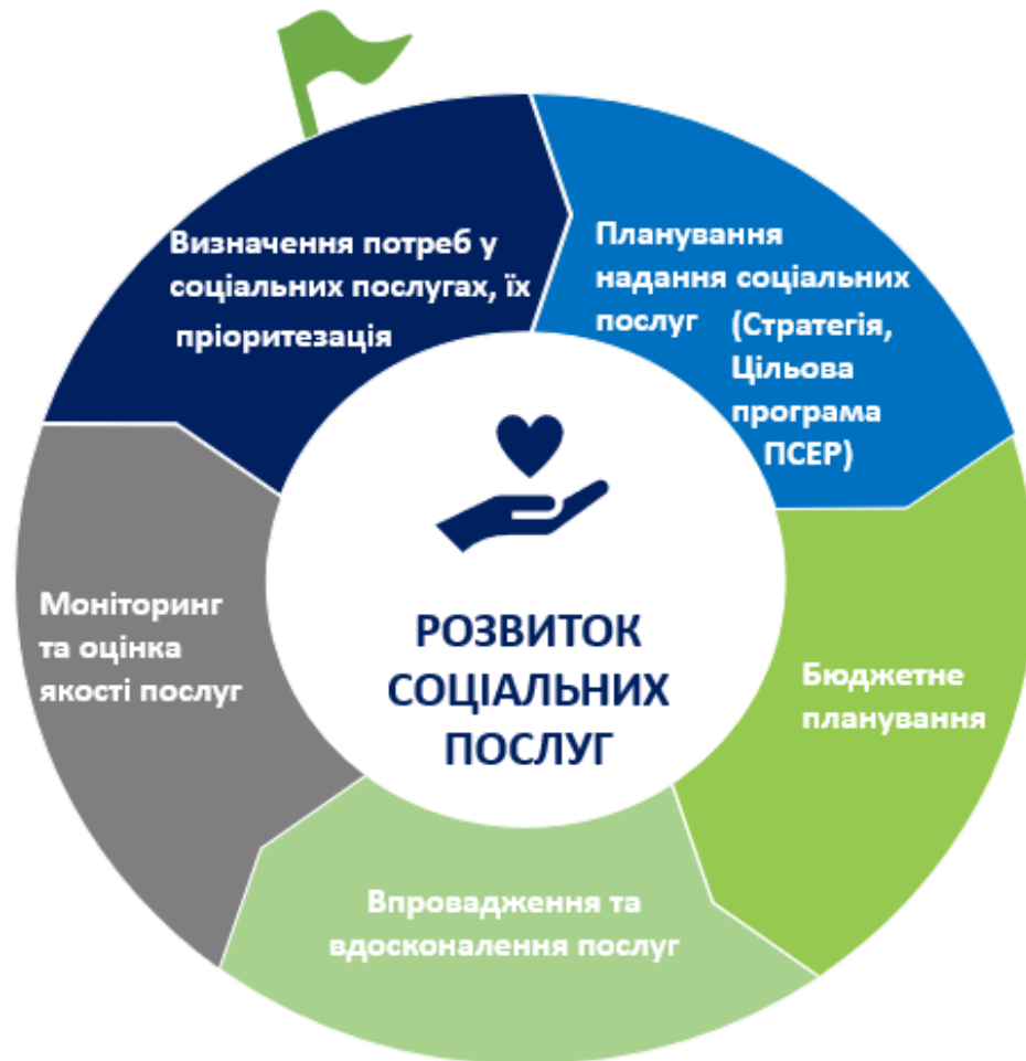
Рис. 1. Порядок організації та надання соціальних послуг у територіальній громаді

*ПСЕР - програма соціально-економічного розвитку громади