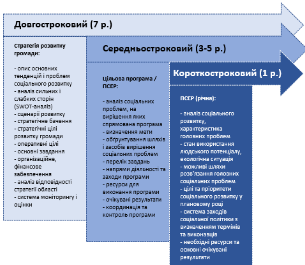
Рис. 2. Система програмних документів розвитку громади

Основоположним документом, що визначає пріоритети розвитку територіальної громади є стратегія її розвитку (див. рис. 2). У цьому документі на довгострокову перспективу (7 років і більше) окреслюють орієнтири розвитку ключових сфер життєдіяльності громади. Для цього проводять ґрунтовне аналітичне дослідження, визначають сильні та слабкі сторони громади, бачення її розвитку, стратегічні й оперативні цілі та розробляють детальні завдання, виконання яких має забезпечити досягнення визначених цілей.